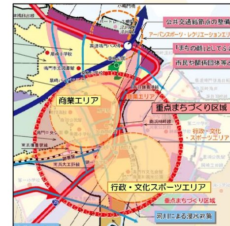
重点まちづくり区域内の対象エリア