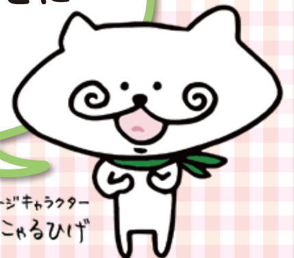
鳴門市イメージキャラクター 「にゃるひげ」

かぞく や しんせき ひと の人、先生 せんせい や きんじょ ひと の人、おみせ や かいしゃ ひと の人、 しゃくしょ ひと の人、 おとな おとな みんなで あなた が しあわせに なれるように がんばります。