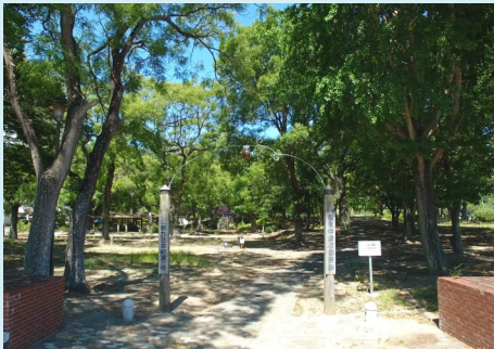
板東東俘虜収容所跡