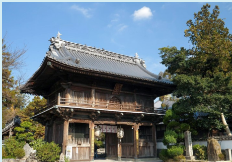
四国八十八か所一番霊場「霊山寺」