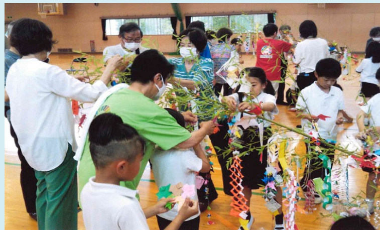
地域のふれあい活動で、七夕飾りを作り飾りました。