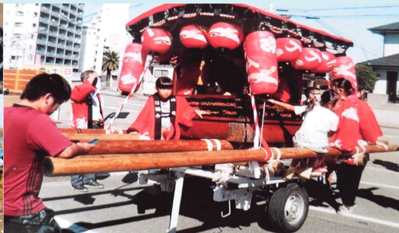
林崎妙見山神社の秋まつりが開催されました。