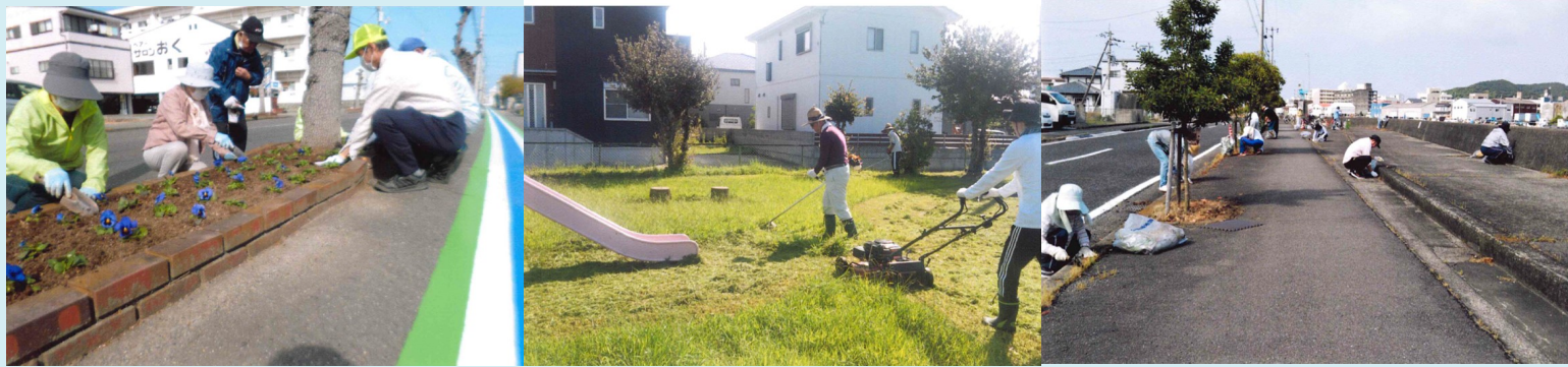
ポカリスエットスタジアムの花壇に花を植えたり、公園の草刈活動や、道路の美化活動に取り組んでいます。