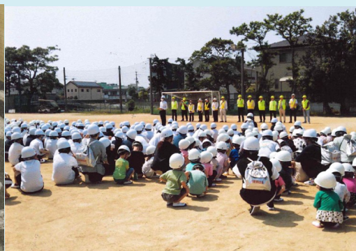
避難所の設営体験や避難訓練を実施しました。いざという時に落ち着いて行動できるように訓練し、地域の人たちとも顔見知りになることを心がけています。