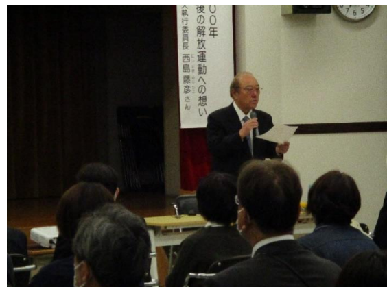
ぶらくかいほうどうめい にしじまちやうおうちゅういんちやう こうえんかい ▲【部落解放同盟 西島中央執行委員長による講演会】