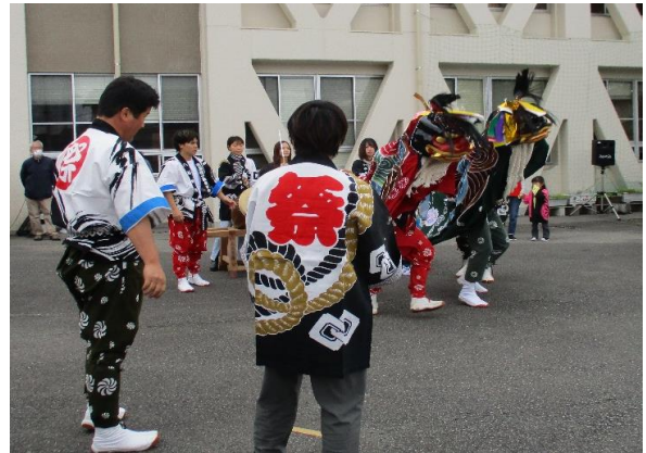
いちば ししまい ほぞんかい ししまい ひろう ▲【市場獅子舞保存会による獅子舞披露】