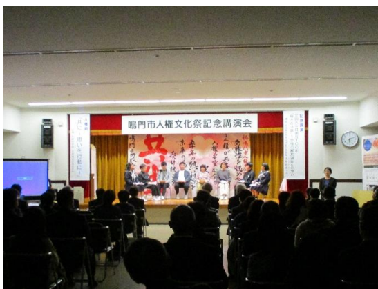
おおさあちやうがっこうせいと じんけんげき ▲【大麻中学校生徒による人権劇】