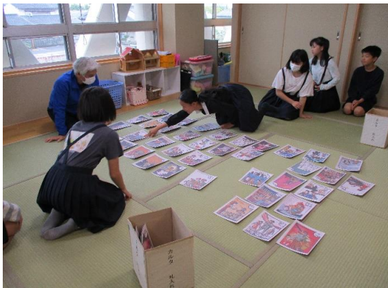
ねん かいさい たいかい ▲【4年ぶりの開催となったカルタ大会】