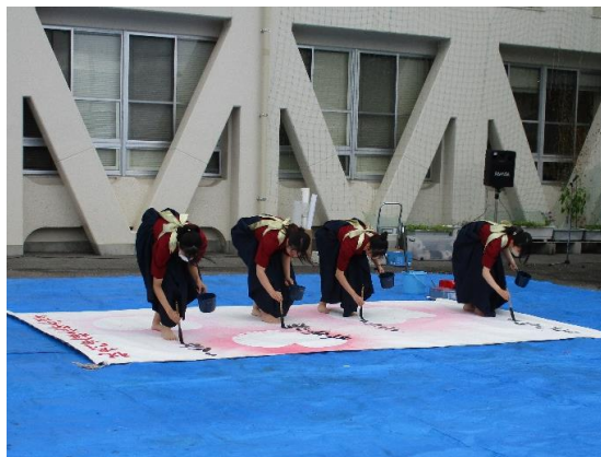
なると こうこう しょうぶ しょう かんせいさくひん ▲【鳴門高校書道部による書道パフォーマンスと完成作品】