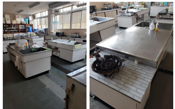
▲調理台、食器棚など