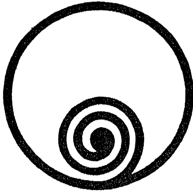
鳴門市市章拡大図

市章 直径 70mm程度 タイトル 公共汚水ます (「ます」のみひらがなで枠有り) 長さ 100mm程度 高さ25mm程度