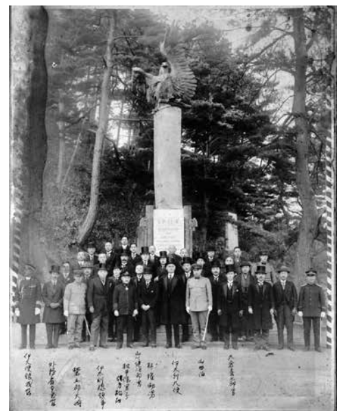
Gedenkaufnahme vor dem von Mussolini gestifteten Gedenkstein der Truppe Byakko-tai

schens Kriegsgefangenen ihrer Kameraden gedachten. Der Gedenkstein für die deutschen Soldaten auf dem ehemaligen Gelände des Kriegsgefangenenlagers Bandō und der Friedhof der Truppe Byakko-tai auf dem Berg Iimori-yama werden jeweils als Kulturerbe bewahrt: die