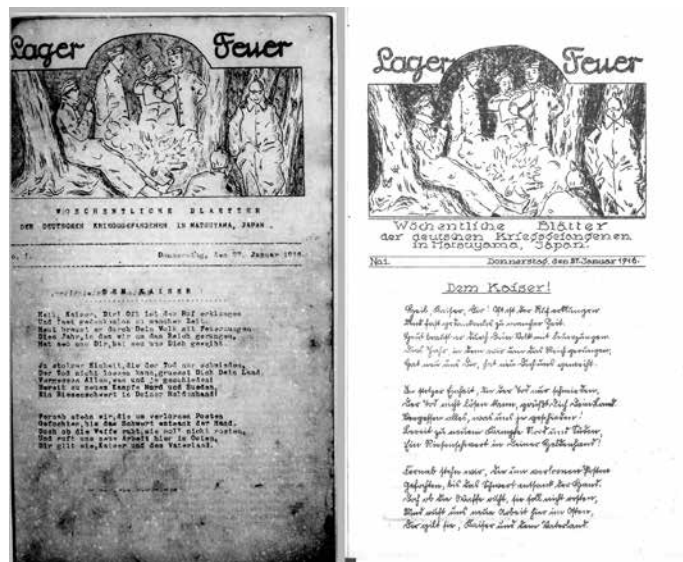
Seite 1 der Erstausgabe von „Lagerfeuer“ links: Matsuyama-Druck, rechts: Bandō-Druck

Lagerzeitung ‚Lagerfeuer‘“ statt. Das Kriegsgefangenenlager Matsuyama wurde im Deutschen Haus bisher noch nicht ausführlich vorgestellt. Hier soll vom Leben und Treiben der deutschen Kriegsgefangenen berichtet werden, wie es sich vor ihrer Zeit in Bandō gestaltete. Dies geschieht anhand von Fotos und Illustrationen, wobei Tafeln mit Artikeln aus dem „Lagerfeuer“ über zahlreiche Aktivitäten berichten, etwa Lernkurse, Musik, Theater und Sport. Natürlich gibt es noch viele andere interessante Artikel, die im Rahmen dieser Ausstellung nicht erwähnt werden konnten. (Kawakami)