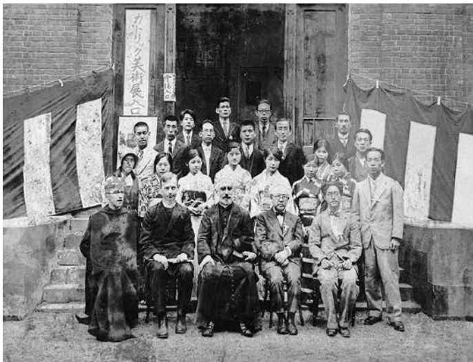
Gruppenfoto der Gesellschaft für Katholische Kunst

Die vier hier vorgestellten Personen aus der Präfektur Tokushima, die in Tokio tätig waren, wirkten bei gegenseitiger Unterstützung in Kirchen, Universitäten und im kreativen Bereich, um einen Beitrag zur Verbreitung des Glaubens und bei der wissenschaftlichen Mission nach Wissen zu leisten. (Mori)