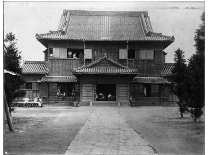
Hauptgebäude des Kriegsgefangenenlagers Tokushima

Die deutschen Kriegsgefangenen kamen am 17. Dezember 1914 im Kriegsgefangenenlager Tokushima an und blieben dort bis zum 6. April 1917, als sie nach Bandō verlegt wurden. Das Lager Tokushima befand sich in der Nähe des Parkplatzes an der Westseite des heutigen Präfekturverwaltungsgebäudes, wo sich damals das Präfekturversammlungsgebäude (auch als „Stadthalle“ bezeichnet) befand.