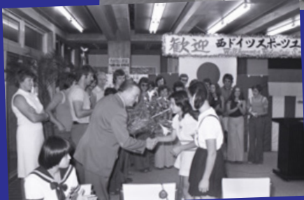
鳴門東幼稚園 (1980) 鳴門東小学校 (1979)