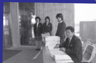
鳴門市職員共済会館 (1973)