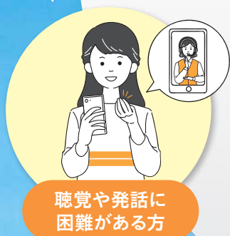
聴覚や発話に 困難がある方