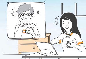
●家族や友人との会話