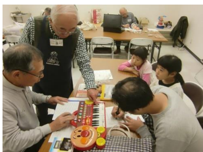
～おもちゃの病院～ ドクター・スタッフ募集！