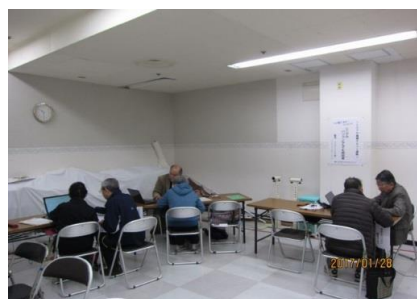
～シニアICT塾～ 仲間を募集！

「シニアの地域デビュー講座」では、学び・交流、そして皆さんの活動参加を募集しています。