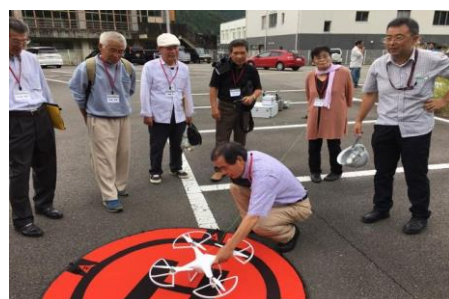
～ドローン活用～ 地域活性化のアイデア募集！