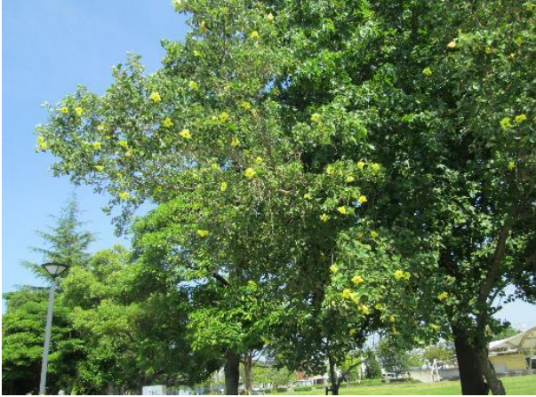
うずしおふれあい公園内