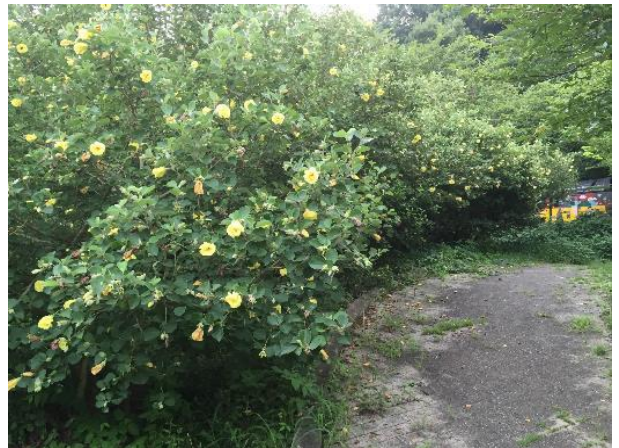
賀川豊彦記念館の西隣