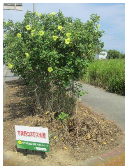
矢倉地区基幹農道