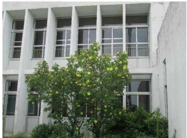
北灘西小学校（休校中）