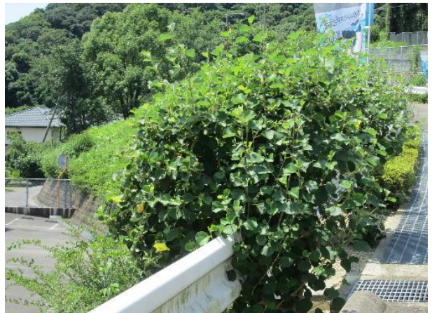
高速鳴門バス停留所