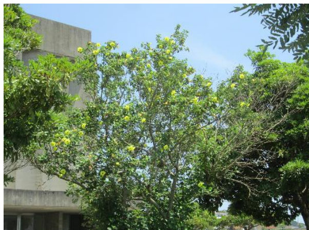
鳴門市文化会館の南側緑地