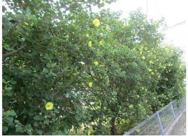
斎田折蝶はまぼう通り