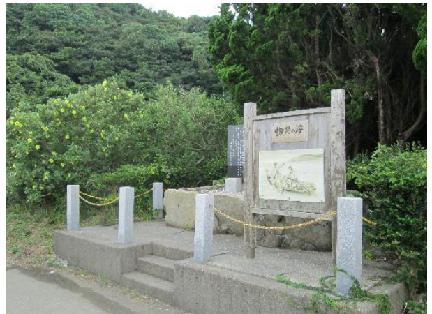
島田少年兵救助記念碑（田尻浜）