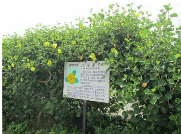
堀江北小学校の西側