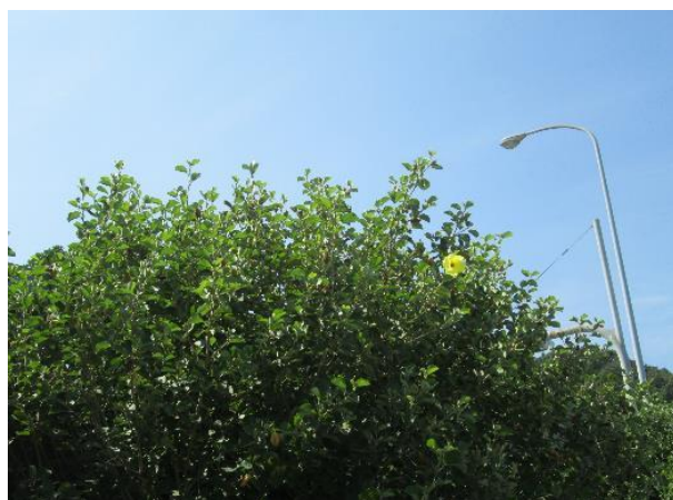
木津中山はまぼう通り（国道11号線東側 側道）