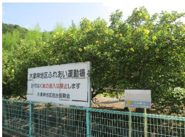
木津神地区ふれあい運動場（木津中山春日神社の裏）