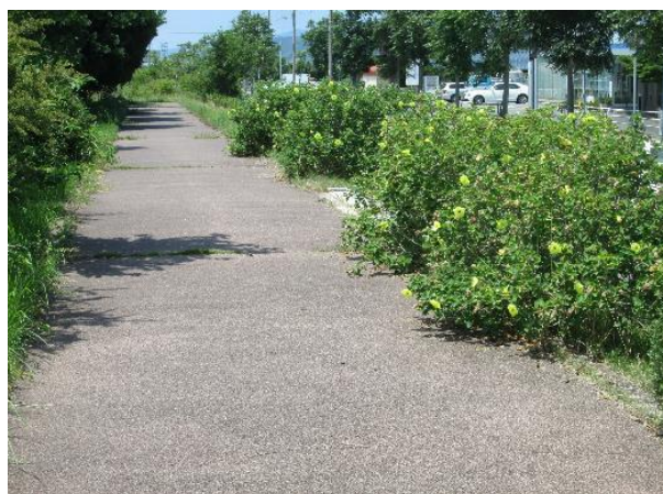
ライオンズの森（文化会館の南西側 遊歩道）