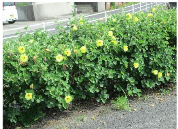
鳴門西小学校の周辺