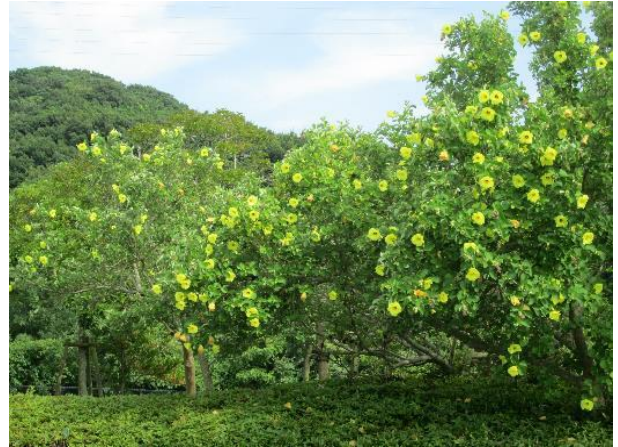
鳴門ウチノ海総合公園