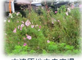
木津原地中央広場