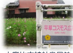
大麻比古神社鳥居前