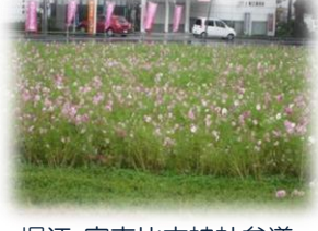
堀江 宇志比古神社参道