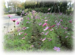
うずしおふれあい公園