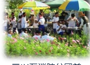
三ツ石消防分団前