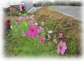
県道津慈広島大麻線交差地