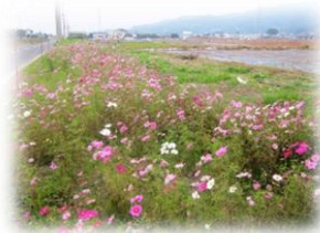
牛屋島川渚基幹道沿い