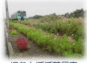
旧たんぼぼ薬局東