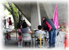
鳴門市役所前広場