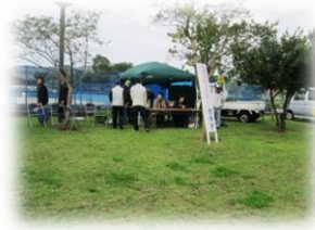
鳴門ウチノ海総合公園