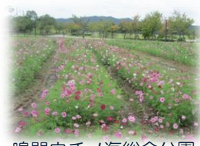
鳴門ウチノ海総合公園 お花畑