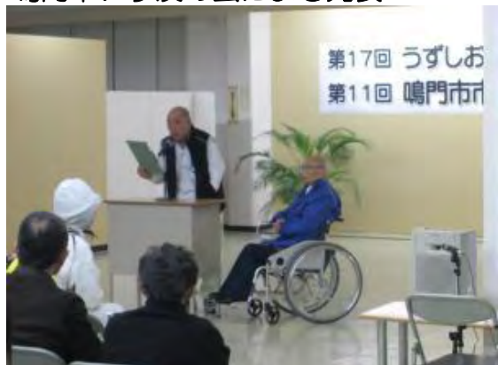
鳴門車いす友の会による発表