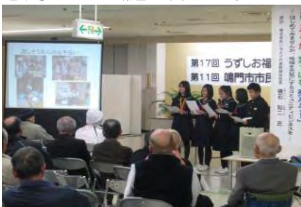
里浦地区自治振興会