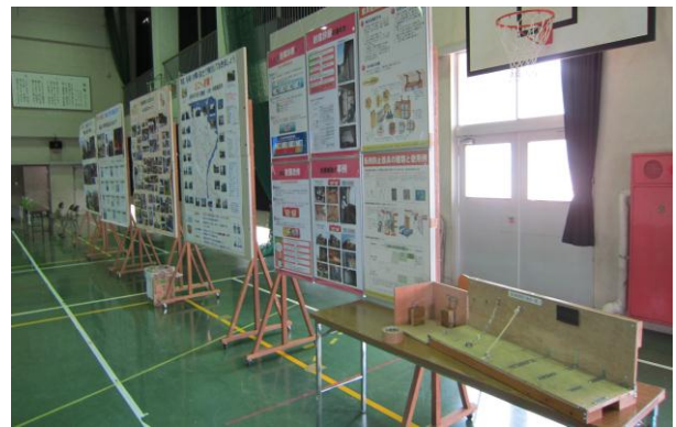
県立防災センターのパネルも展示されていました。