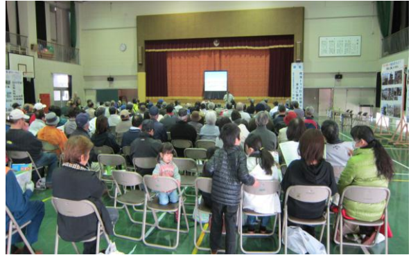
大勢のかたが講演を聴きに訪れました。