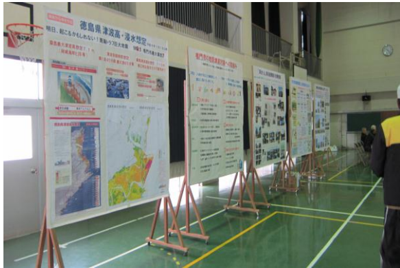
体育館では、地震に関するパネルが展示されていました。