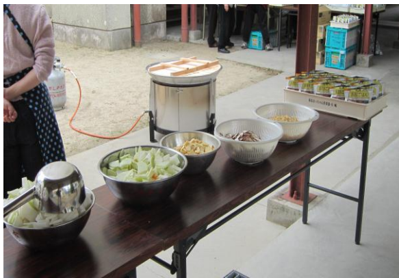
炊出し用に準備された食材