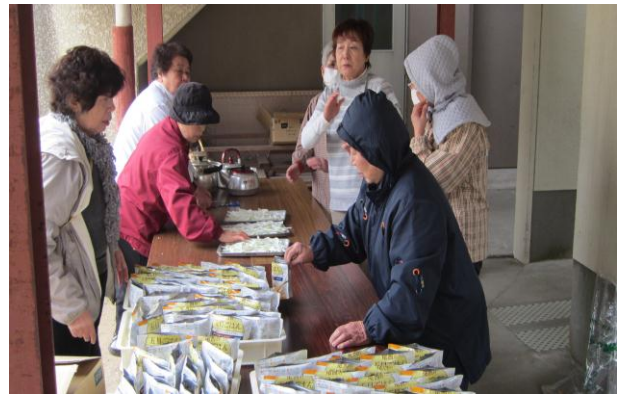
災害用かまどを用いての炊出し。五目ごはん んと豚汁が炊かれました。