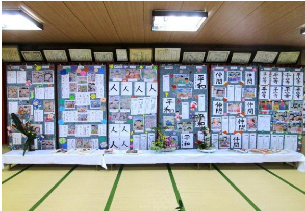
子どもたちの作品 （書道、人権標語等、ポスターなど） 力作が並びます。