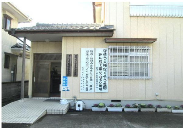
会場となった黒崎集会所

平成26年12月5日（金）、6日（土）の2日間にわたり、撫養町黒崎にある黒崎集会所で「黒崎地区人権展」が開催されました。寄せ植えや生花、編み物、写真、絵画、焼き物、木彫、手工芸など、みなさんの思いがたっぷり詰まった作品が展示されました。また、素直な心が表現された子どもたちの作品も並び、訪れた人々の目を楽しませていました。