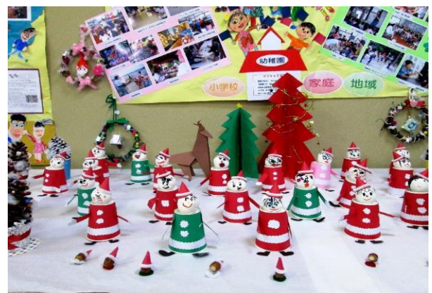
黒崎幼稚園 園児の作品