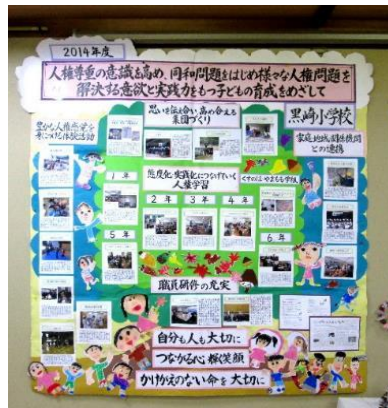
黒崎小学校 児童の作品