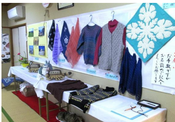
キルト、手編みのセーター、染色作品