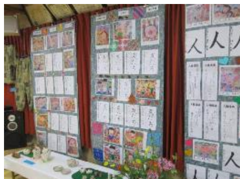
黒崎小学校 児童作品