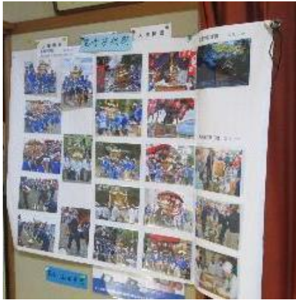
黒崎っ子花まつりの写真