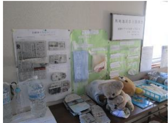
黒崎地区自主防災会による 避難グッズの展示