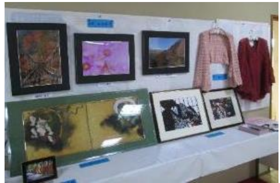
写真・手編み製品など