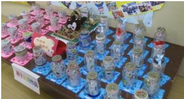
親子共同作品 かわいいランタンが並んでいました 🐰🐰