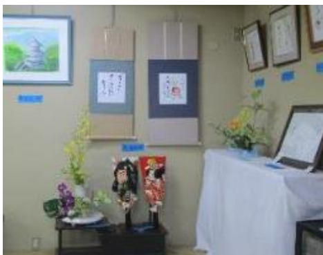
絵画・手工芸など