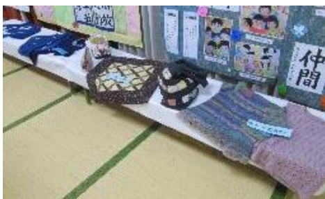
藍染・パッチワーク・編み物