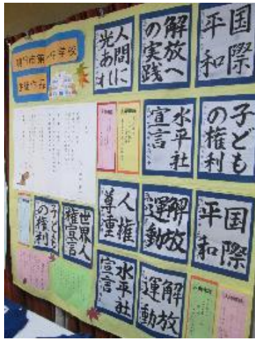
鳴門市第一中学校 生徒作品