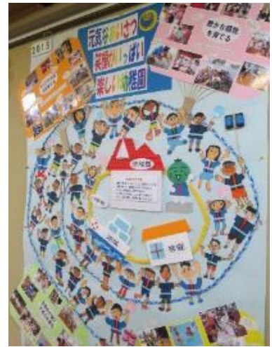
黒崎幼稚園 園児作品