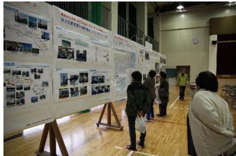
地震・津波に関するパネル展示