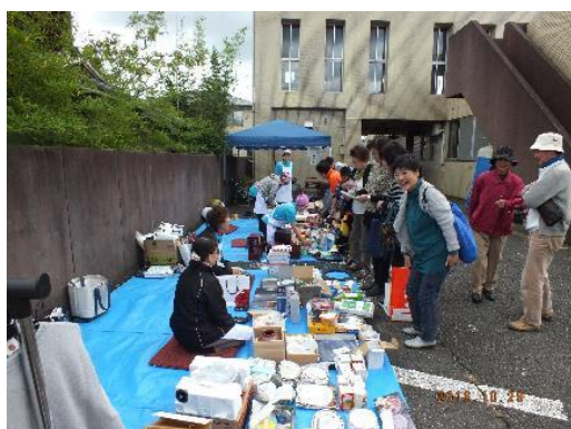
川東婦人会 バザー開催