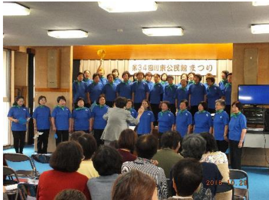
合唱（童謡を歌う会 浜千鳥）