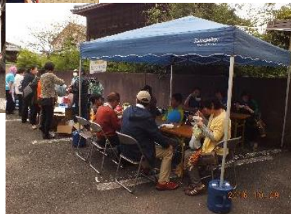
災害用炊飯器で調理した おぜんざいが振る舞われました。