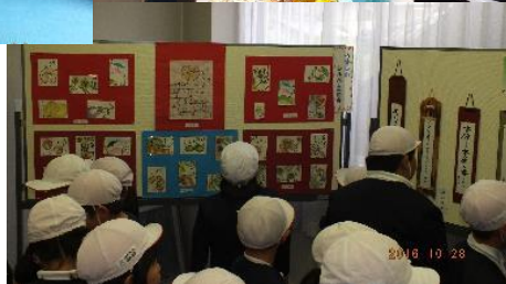
林崎小学校の児童たちが見学に来ました！