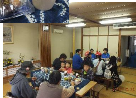
和室には喫茶コーナーを設けました。