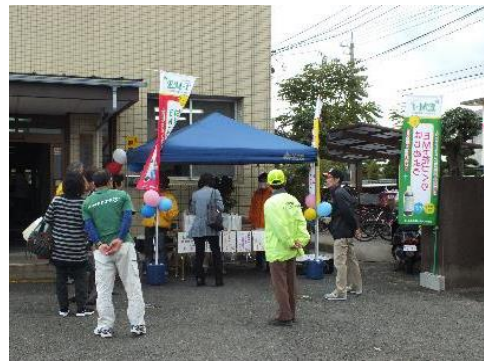
ボランティア川東 EM活性液の配布