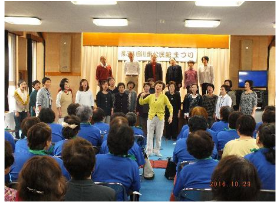
合唱（ハッピーコーラス）