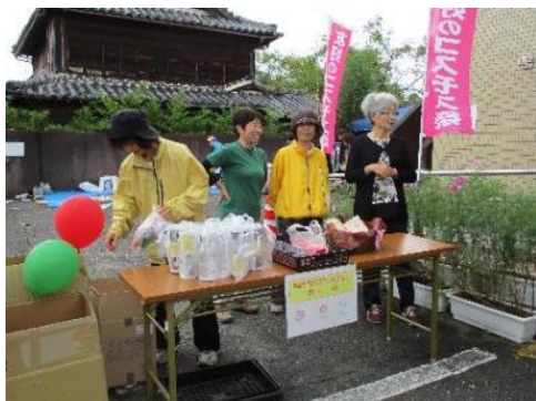
コスモス祭りの接待所