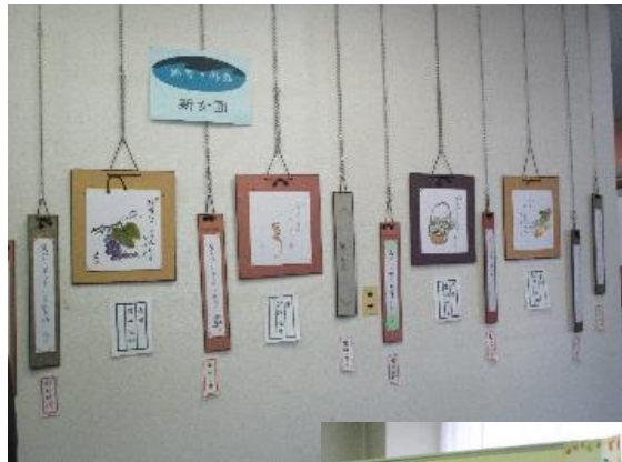
新女園、もののその句会、浜木綿句会による俳句展示