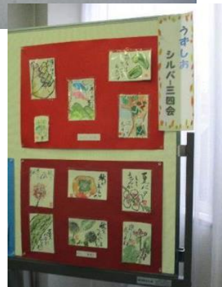
川東婦人会・女性学級の作品展示