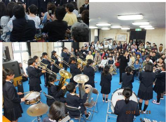
林崎小学校金管クラブの演奏