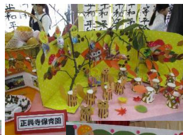
正興寺保育園の作品