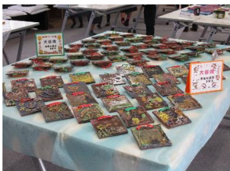
撫養幼稚園 園児の作品