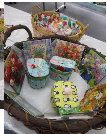
書道・藍染製品・手作り製品他