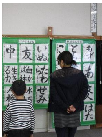
祥瑞書道学園の作品