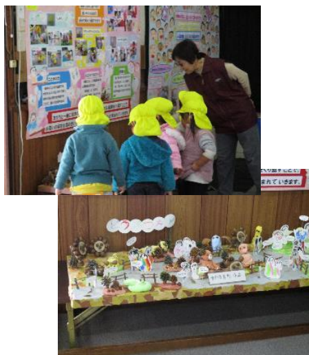
中央保育所の作品