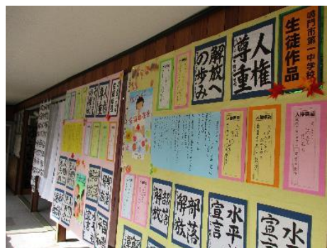
鳴門第一中学校 生徒の作品