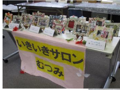
いきいきサロン 睦会の作品