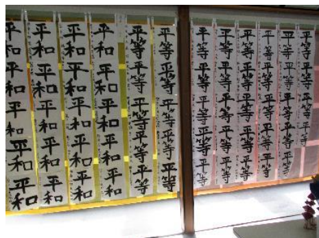
撫養小学校 児童の作品