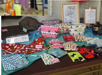
鳴門ドレメの作品