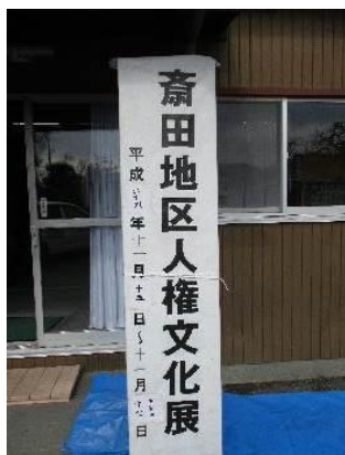
会場となった齋田集会所

また、併せて子どもたちの作品も展示され、見学に訪れていた子どもたちも作品を興味深く見ていました。