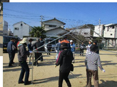
テントの設営を一から学びました。