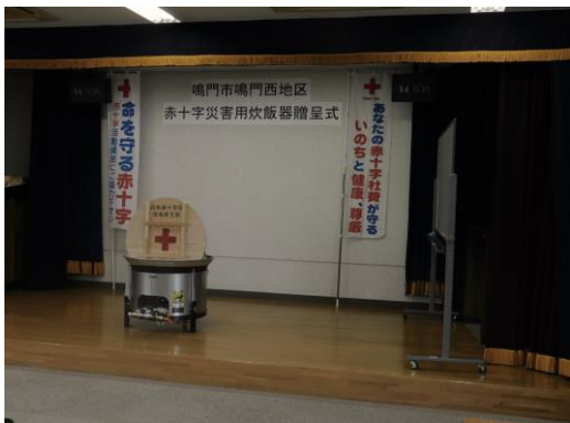
会場となった鳴門公民館

奉仕団・自治振興会・社会福祉協議会・自主防災会・民生児童委員協議会等約30名が参加しました。