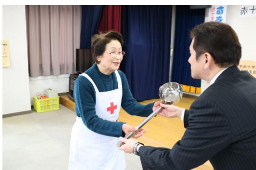
日本赤十字社徳島県支部泉鳴門市地区長より、日赤鳴門西分団委員長が受取りました。