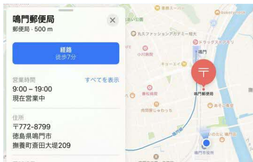
スマホ地図画面の「鳴門郵便局」 手机地图上的“鸣门邮局”

左上の「〒」マークは日本の郵便記号です。 1885年、郵政事業を管轄する通信省が設立されました。1887年2月8日、通信省は「T」を徽章にすると発表しましたが、後2月14日、「T」を「〒」に変更しました。変更の経緯に関しては諸説があるそうです。また、通信省は1949年に郵政省と電気通信省とに分かれ廃止されました。時代が変わりましたが、徽章の「〒」は郵便ポストや看板、地図などに幅広く使われており、正式な郵便記号になりました。