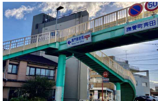
歩道橋の上にある「鳴門郵便局」の案内板 天桥上的“鸣门邮局”路牌

1885年，日本设立掌管邮政等业务的“递信省”。1887年2月8日，递信省宣布“T”为该机构的徽章标识。但是，在不久后的2月14日，递信省又宣布将“T”更改为“〒”。关于更改原委，说法诸多，此不赘述。递信省已于1949年被划分为邮政省和电气通信省后而解散。但“〒”字符号被沿用至今，成为了官方认定的邮政标志，在邮筒、路牌、地图等处都可看到。