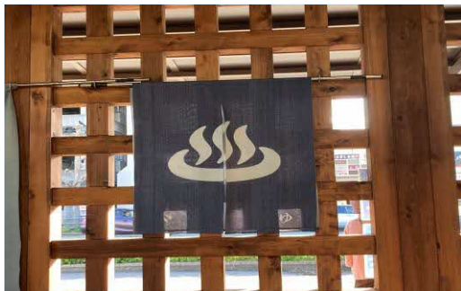
温泉施設の暖簾／温泉施設の布帘

温泉は日本の重要な観光資源でもあります。しかし、このマークは温かい食べ物の標識だと外国人の観光客に誤解されるケースが多いそうです。東京オリンピックの誘客のためでもあり、2017年に現行の温泉マークに、温泉に浸かっている3人が追加されました(右上図)。旧マークと新マーク両方が使われ、各施設が選択できるということです。