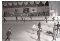
ローラースケート大会(昭和37年)

建設当時の貴重なアーカイブ写真や映像、図面や建築写真など、これまで歩んできた歴史をともに振り返り、記録と記憶を継ぎたい機会としていただければ幸いです。