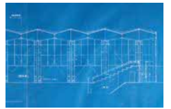
当時の設計図(東西断面図)