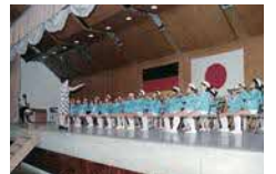
リューネブルク市との交歓音楽会(昭和50年)