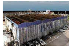
3D点群によるデジタルアーカイブ(令和2年)