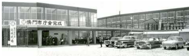
鳴門市庁舎落成式(昭和38年) ※市民会館完成の2年後に本庁舎が完成

鳴門市市民会館は1961年(昭和36年)11月に落成し、現在まで59年の長い間、ローラースケートや卓球、バレーボールなどのスポーツをはじめ、市の行事や成人式、コンサートやプロレスなど様々な場面で使用され親しまれてきました。