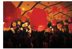
クリスマスマーケット(平成30年)