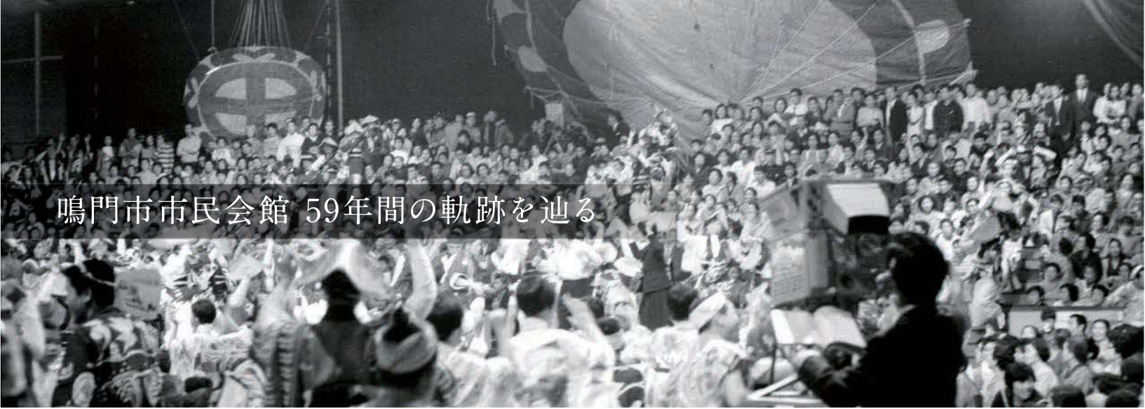
「NHKふるさとの歌まつり」収録風景(昭和45年)