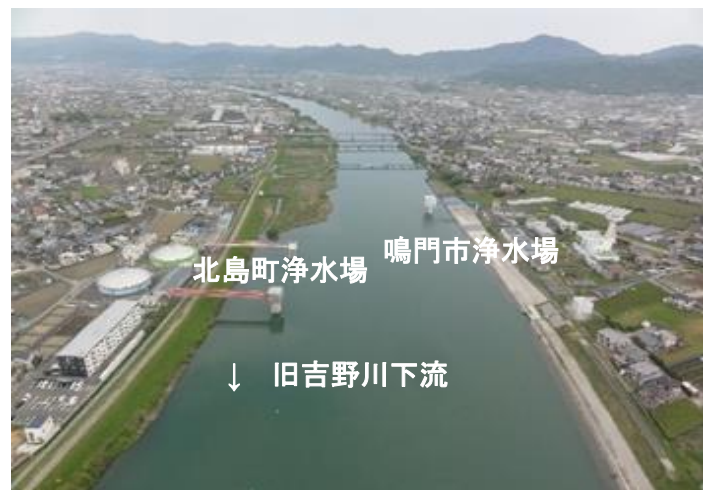
北島町との共同化を進めている浄水場

浄水場だけでなく、水道施設の更新にあたっては、ダウンサイジング（施設の小規模化）などによる経費節減を図ります。