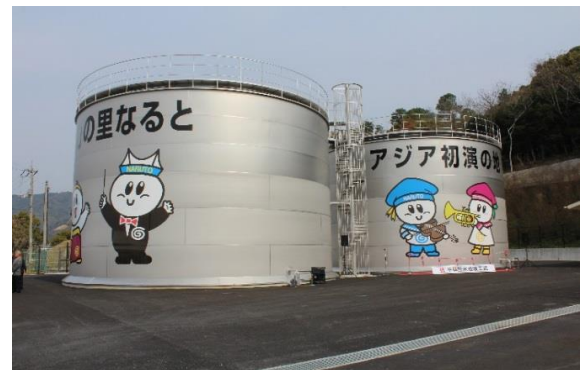
平成27年度に完成した平草配水池