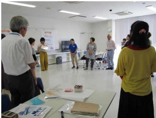
【「一言自己紹介」の様子】

今回は、「ぶっちゃけ聞かせて！孫（子）育て 親の本音と祖父母の本音」と題して、日頃、言いにくかったり、聞きにくかったりする感謝の気持ちやモヤモヤした気持ちを伝え合い、つきあい方のコツを考える講座となりました。