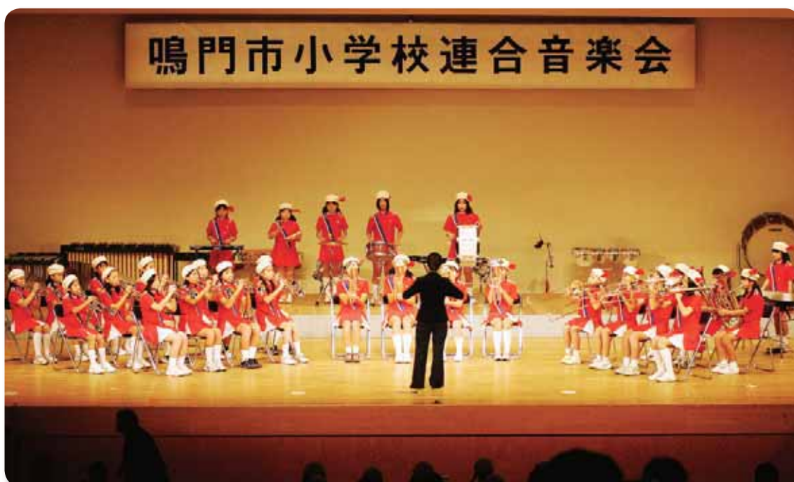
▲ 鳴門市小学校連合音楽会