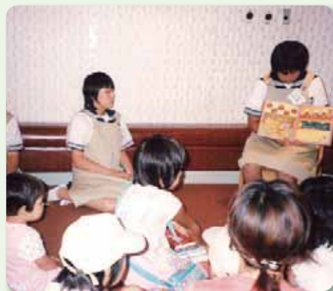
中学生の職業体験時の「おはなしタイム」