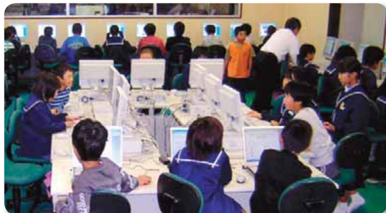
▶ コンピュータ学習