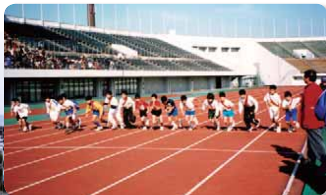
▲ スポーツ少年団駅伝大会