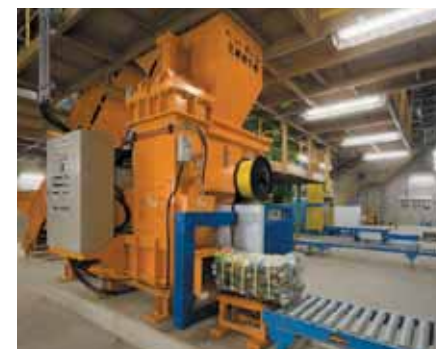
■ペットボトル圧縮梱包機 回収されたペットボトルを圧縮し梱包します。