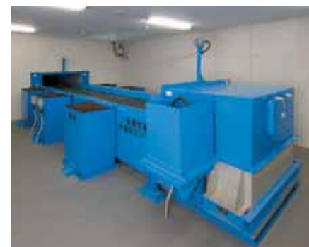
■容器包装手選別コンベヤ 手作業により異物を取り除きます。