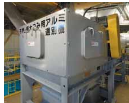
■不燃・粗大ごみ用アルミ選別機 電磁力の力を利用して、ごみをアルミと残渣に選り分けます。