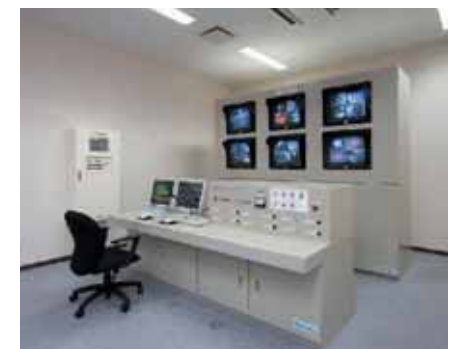
■中央操作室 施設全体の処理ラインを管理します。機器の状態や処理の状況をテレビモニタなどで監視し、安全で効率の良い運転を行います。