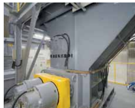
■低速回転式破砕機 ゆっくりと回転する刃でごみを大まかに破砕し、その後の処理をスムーズにします。