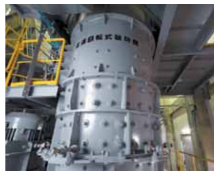
■高速回転式破砕機 高速回転式破砕機で、たたき・砕き・切断してさらに細かくします。