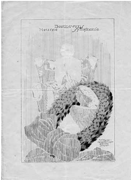
Programm zur Erstaufführung der Neunten Sinfonie Beethovens

ist dabei nicht nur in ganz Japan bekannt, sondern zieht auch immer wieder Chorgruppen aus anderen Gefilden an, wie zum Beispiel zuletzt aus Los Angeles.