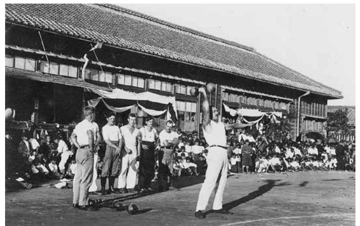
Kriegsgefangene mit Hanteln vor japanischen Zuschauern

teilgenommen haben sollen. Mit dieser neuen Information warf ich einen erneuten Blick auf die Fotos von Herrn Klopp, worunter sich neben dem oben bereits erwähnten Bild auch eine Aufnahme befindet, bei der einige Soldaten mit Hanteln vor japanischen Schülern zu erkennen sind. Allerdings scheint es sich hier um einen anderen Tag zu handeln, da dieses Bild mit der Notiz „Fest der neben dem Gefangenenlager gelegenen Schule aus Anlass der Krönungsfeier im Jahr 1915“ versehen ist. Der Jahrestag der Krönung des damaligen japanischen Kaisers, dem Taisho-Tenno, war der 10. November. Dies lässt vermuten, dass die Kriegsgefangenen von Oita in jenem Jahr mindestens zweimal bei einer Veranstaltung der Grundschule auftraten. Dass die Soldaten also mehrfach um einen Auftritt gebeten worden, zeugt möglicherweise davon, wie beeindruckt und fasziniert die dortige Bevölkerung von dem Können der Deutschen gewesen sein muss.