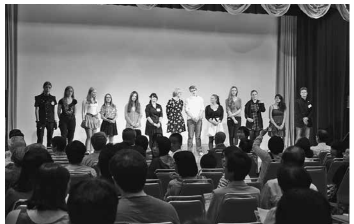
Die Jugenddelegation auf der Bühne während des Deutschen Festes in Naruto