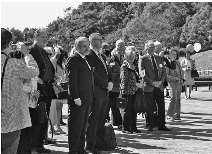
Die Freundschaftsdelegation auf dem Platz vor dem Deutschen Haus

Am 16. Oktober des vergangenen Jahres reiste die 20. Freundschaftsdelegation aus Narutos Partnerstadt Lüneburg mit einer beachtlichen Teilnehmerzahl von 60 Personen nach Japan. In den darauffolgenden vier Tagen fanden daher in der Stadt Naruto zahlreiche Veranstaltungen statt, wie auch in der Novemberausgabe des Stadtmagazins „Koho Naruto“ nachgelesen werden kann. Uns im Deutschen Haus besuchte die Delegation am 17. Oktober, als hier die Begrüßungszeremonie im Rahmen eines Deutsch-Japanischen Bürgernachmittags abgehalten wurde. Diese Veranstaltung war ein Teil der Feierlichkeiten zum 40. Jubiläum der Städtepartnerschaft, die bekanntermaßen 1974 mit der