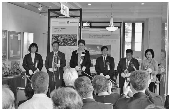
Beim Zerschneiden des Bandes

Besucher des Deutschen Hauses kennen sie, die Niedersachsen-Ausstellungsecke im Erdgeschoß des Deutschen Hauses. Am Mittwoch des 9. Julis 2014 wurde die Ausstellungsecke im Rahmen des Besuches einer niedersächsischen Delegation um die Staatssekretärin Birgit Honé von der Staatskanzlei neu eröffnet. Diese Ausstellungsecke zu Niedersachsen ist die einzige ihrer Art in ganz Niedersachsen und wurde das erste Mal seit neun Jahren komplett überarbeitet. Dabei wurden nicht nur das Design und die Inhalte der Poster verändert, sondern auch die Vitrinen mit neuen, wieder aus Niedersachsen stammenden Produkten und Gegenständen bestückt.