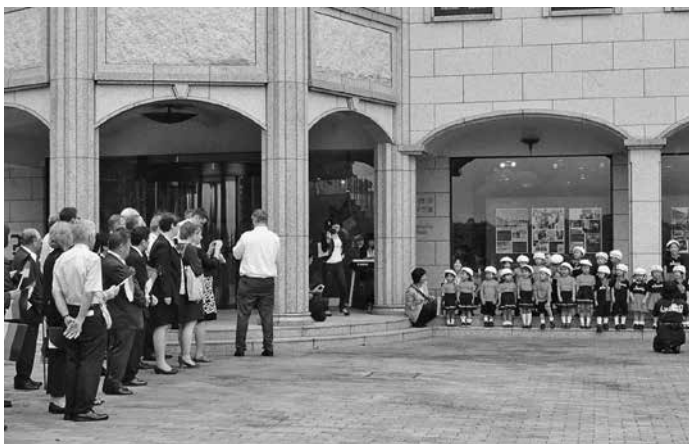
Kinder singen „Ode an die Freude“ zur Begrüßung der Delegation