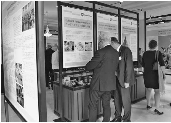
Die Delegation begutachtet die neuen Ausstellungsinhalte