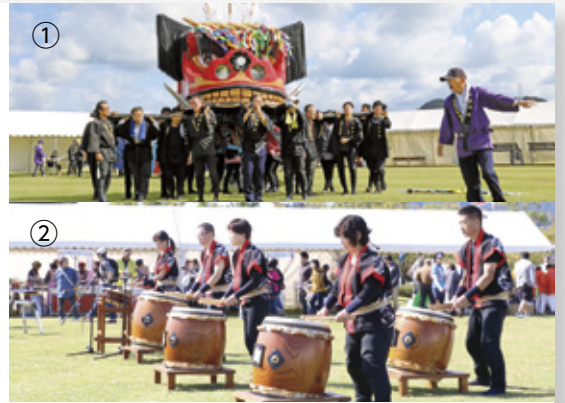
① 香川県三木町の約3疋を超える大獅子 ② 伝統芸能の鳴門渦潮太鼓

10月20日、21日に鳴門ウチノ海総合公園で「四国の肉グルメ&祭りフェス」が開催されました。この行事は、四国の玄関口である鳴門で四国の良さを体感してもらおうと、四国4県の肉料理や祭りを楽しめるイベントで、昨年に続き今回で2回目の開催。中でも香川県三木町の大獅子は迫力満点で、観客から驚きの声が上がっていました。また、21日には、恒例の「鳴門のまつり」と「子どものまちフェスティバル」も同時開催され、会場には2日間で家族連れなど約24,000人が詰めかけ、イベントを楽しんでいました。