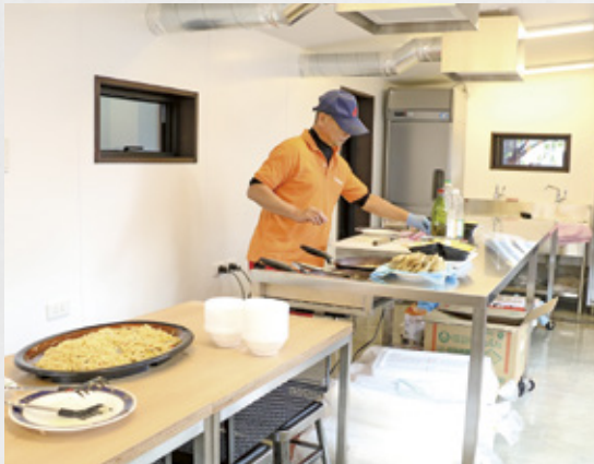
「海ン家」で北灘の地元食材を調理するスタッフ