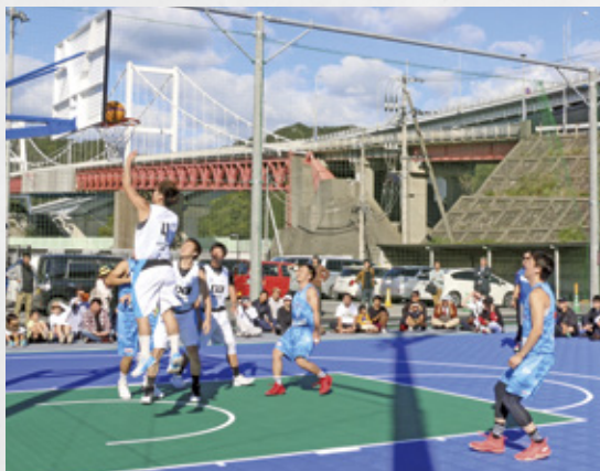
プロの選手によるエキシビジョンマッチ