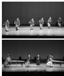
○昨年の鳴門市芸能祭の様子

市 文化協会に所属する会 員が日頃の練習の成果 を披露します。 【日 時】11月11日(日) 午前9時30分～ 午後6時30分 【場 所】市文化会館 【内 容】吟詠、合唱、大正 琴、邦楽、洋楽、演劇、 健康体操、ダンス、スト リートダンス、バレエ、フ ラダンス、小唄、日本舞踊、 民踊など ◆同時開催 市文化協会 ハンドメイドマルシェ 【日 時】11月11日(日) 午前9時～午後3時