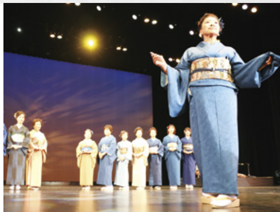
ポーズを決める染色教室「彩」の受講生

10月21日、市文化会館で藍染ファッションショー「今、いのち華やいで～藍を世界へ～」が行われました。同イベントではキョーエイ鳴門駅前店で開設している染色教室「彩」の受講生86人自らが着物やワンピースなど衣装212点を身にまとい、モデルとして登場。思い思いのポーズを決めるなど会場を盛り上げました。モデルたちの自信に満ちあふれた姿や藍染の美しさに観客席から大きな拍手が起こっていました。このイベントは2年ぶり6回目の開催です。