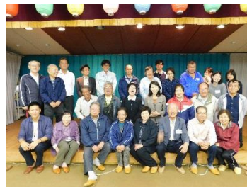
座談会後の記念写真

グループワーク後の発表では、1) について「一声運動を進める」「サロンやお茶会、グランドゴルフなどいつも参加している人が参加していなければ自宅に電話する」「もしもに備えてお隣の緊急連絡先をしておく」「今行っている活動を継続する」などの意見が出されました。また2) については「事業者にコミュニティバス・タクシーの運営を働きかける」「既存の配達サービスを活用する」「友人、家族の協力などみんなで支え合っていく」など課題解決のための活動のアイデアが発表されました。