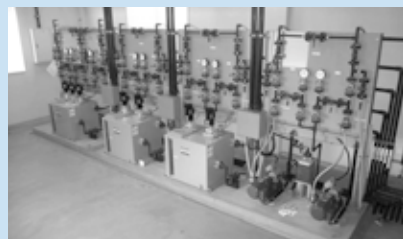
A 薬品注入設備(次亜塩) 水を消毒するための塩素剤を注入する設備です。