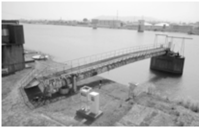
1 取水塔 旧吉野川の水をポンプで取り入れます。

鳴門市浄水場は、旧吉野川の水を取り入れて、安全で安心して飲むことができる水道水にするところです。7月号で浄水場のしくみ(工程)を図で紹介しました。今回は浄水場のさまざまな施設や設備のうち、一部を写真でご紹介します。