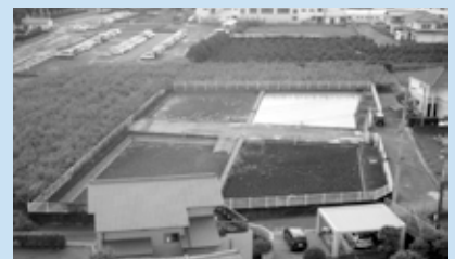
B 天日乾燥床 川から取り入れた水に含まれるにごりを集めて乾燥させます。