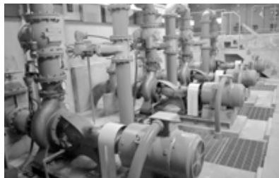
5 送水ポンプ できあがった水を配水池へポンプで送ります。