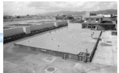
4 浄水池 きれいになった水を貯めておきます。