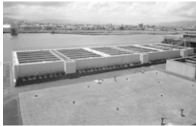
2 沈でん池 凝集剤を入れて水のにごりを固まりにして沈めます。