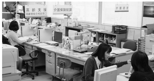
高齢者総合相談窓口

【答】 長寿介護課に高齢者総合相談窓口を開設して、高齢者のあらゆる相談に直接対応する体制を整えています。各地域では地域包括支援センターが迅速、適切に対応しています。