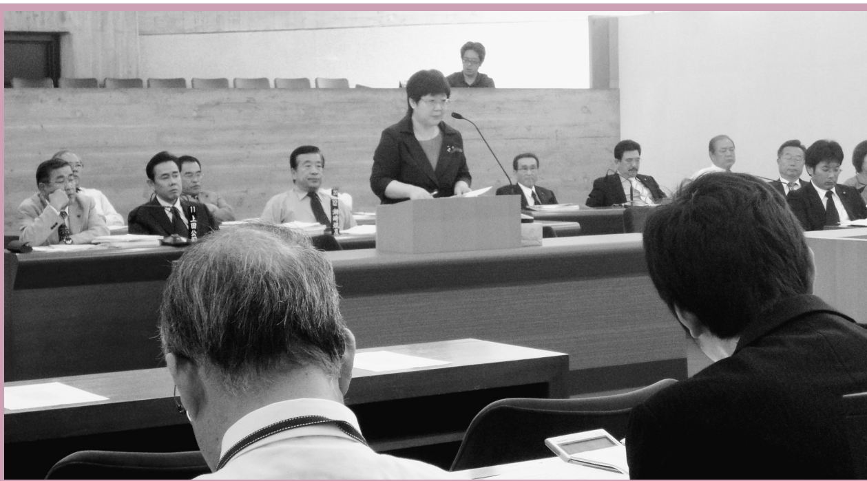
10月13日に行なわれた予算決算委員会全体質疑での平成21年度決算審査の様相