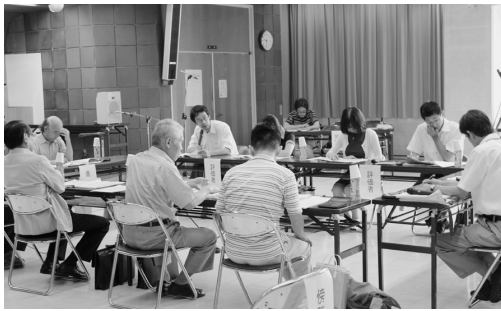
事業仕分けの模様

とりがわかりにくい、とてもわかりにくい。」21%の答え。「どちらともいえない」と答えた方が35%、合わせて約6割。主な意見の中でも、仕分け人の質疑が具体性に欠ける。仕分け時間についても、質疑の時間が短すぎて、セレクモニーにすぎない感じがした。もっと時間をかけてほしい。事業説明するには時間が短すぎる等の厳しくも建設的な意見が寄せられている。今回の事業仕分けをどのように総括しているのか。また今後の取り組みを伺いたい。