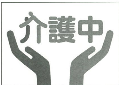
静岡県で考案された在宅介護者であることを周知する「介護マーク」

今後、国からの財政支援措置などの情報収集に努めながら、近隣町とのさらなる広域連携の推進とあわせて、共同事業の具体的な実施課題について庁内で検討する場を設置し、調査・研究を行います。