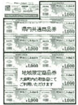
10%のプレミアムが付く「阿波とくしま・商品券」

答 低所得者への臨時福祉給付金や子育て世帯への臨時特例給付金、プレミアム付き商品券の発行事業、中間所得層の保育料の負担軽減、一部の公共料金の据え置き等に対応します。