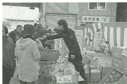
新鮮な農産物を求める 人でにぎわう土曜市

答 大型産直施設の設置を望む生産者も多く、農産物の販路拡大だけでなく滞在観光施設としての活用等、農業振興に有益な施設ですが、建設費用の問題、また年間を通じた販売品目の調達が不可欠であることなどから、広域的な生産者団体の協力運営が必要になってきます。そうした課題を解決するため、今後も、JAやJF等の生産者団体と協議を進めたいと考えています。