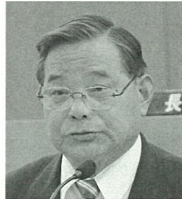
郷土 派 会 やす かわ たく し じ 次 川 靖 宅