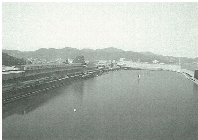
新スタンド建設に向け準備を進める鳴門競艇場

答 市財政に寄与するとともに、雇用などの経済効果により、地域活性化に不可欠な事業であると考えており、今後も競艇事業の安定的な経営を行い、一般会計への繰出金はもとより、地場企業として、再び鳴門市の発展と活性化に貢献できる事業となるよう努めます。