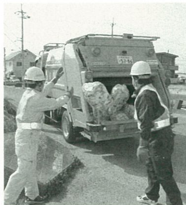
「分ければ資源、捨てればごみ」分別にご協力

出される瓶やペットボトル、資源ごみ回収団体が回収する新聞や雑誌等およびクリーンセンターで中間処理後に取り出される鉄やアルミ等を、リサイクル協会等を通じて再資源化または再商品化しています。 なお、本市のごみのリサイクル率は、環境省の一般廃棄物処理実態調査では25・7%となっており、県や国を上回っています。