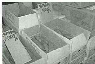
全国に誇る鳴門の特産物 「なる金時」

答 農水産物の海外輸出については、県内外との連携を図り、スケールメリットを生かした効果的な輸出に県が主体で取り組んでおり、本市ブランド農産物の中では、なる金時が香港や台湾、シンガポール等へと輸出されています。今後も、引き続き高い品質と安定した生産量の確保を支援するところで、さらなる輸出拡大につなげていきます。