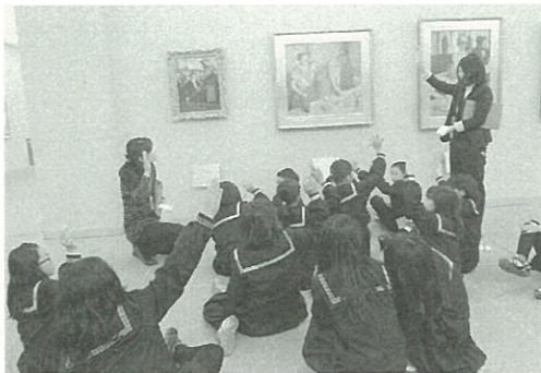
大塚国際美術館との連携による文化芸術教育 (写真は「鳴門市小学4年生鑑賞プログラム」)

答 学校においては、平成19年度より、大塚国際美術館の「鳴門市小学4年生鑑賞プログラム」を活用