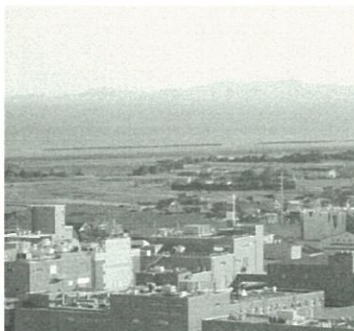
津波避難施設の建設の要望が多い里浦町南部地区

なお、施設の具体的内容や建設場所については、今後地元の方々のご意見を聞きながら決定したいと考えています。