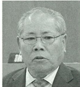
創心 派 会 だ きよ ゆき の 野 田 粹 之