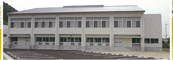
(上) 完成した新体育館 / (下) 総合落成式の様子