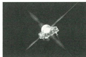
LED照明の使用が電力使用量削減につながる