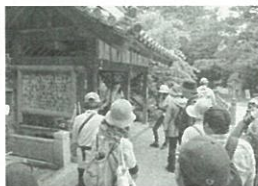
鳴門のPR役として活躍している観光ボランティアガイド

答 鳴門市うずしお観光協会が宿泊施設や観光施設などの従業員等を対象に、もてなしの心の向上の勉強会をしています。また、毎年11月頃にはなると観光ボランティアガイド養成講座を実施し、受講者の方には観光客に鳴門の魅力をご案内していただいています。