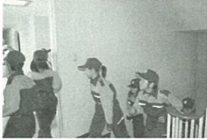
鳴門教育大学、地元小学校との合同防災訓練

学校での防災教育の推進役である教職員の育成については、鳴門教育大学等関係機関と連携した研修の機会を確保し教職員の防災意識を一層高め、子どもの命を守る学校・幼稚園づくりを進めて