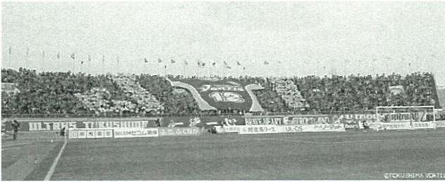
徳島ヴォルティスの応援団

答 ホームゲーム会場やアウェーゲームを活用し、観光PRや農水産品等の特産品PRを積極的にまいります。具体的には、調理器具等を備えた多機能車両を導入し、試食等を実施します。また