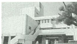
施設の老朽化対策と環境整備を検討する市立図書館

答 図書や資料の充実を初め、インターネット環境の整備や雨漏り対策、館内の照明灯の施設整備、また本棚の転倒防止や蔵書の落下防止などは、今後検討しなければならぬ課題であり、耐震補強工事にあわせて良好な利用環境を確保しながら、必要な対策を講じていきます。