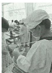
子どもたちに、より安心・安全な給食を

新学校給食センター稼働時には、大規模校への配膳員の配備について検討したいと考えています。