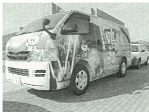
鳴門市を全面に出したラッピングカーで知名度向上を図る

答 行政と事業者あるいは事業者相互で情報・意見の交換や連携を行うことで、新たな商品の開発やより効果的なPRが可能になります。また行政として市の知名度向上やにぎわい創出を図ることにより、観光客の増加や消費拡大、さらに事業者には収益の拡大というメリットを付加することができるかと考えています。